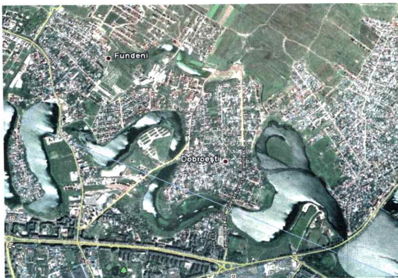
Hartă cu încadrarea teritorială a Comunei Dobroești

Amplasamentul lucrărilor proiectate se afla in comuna Dobroești, jud. Ilfov.